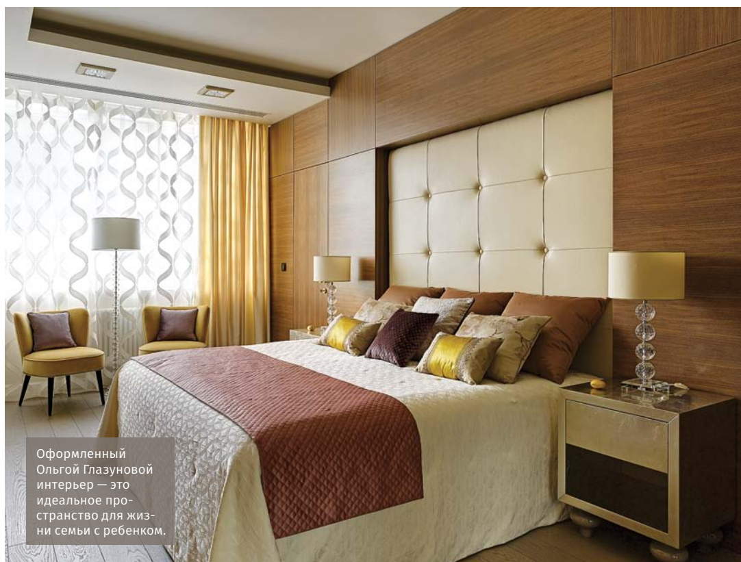
Оформленный Ольгой Глазуновой интерьер — это идеальное пространство для жизни семьи с ребенком.